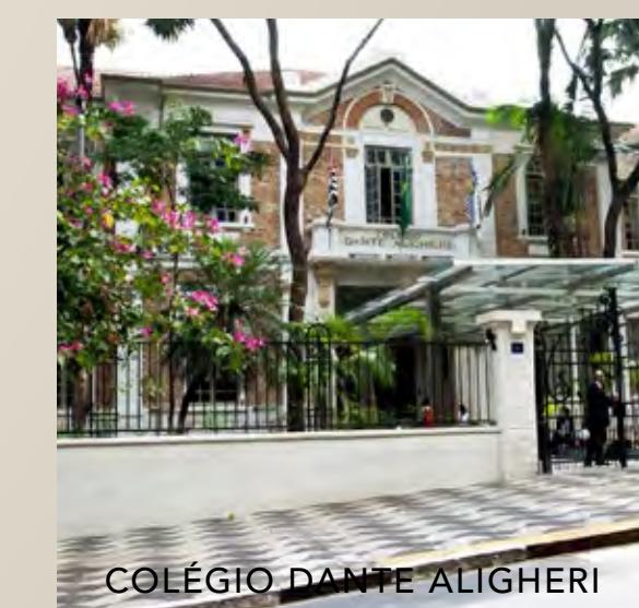
COLÉGIO DANTE ALIGHIERI

MATERIAL PRELIMINAR DE VENDAS. SUJEITO A ALTERAÇÃO. PROIBIDA DIVULGAÇÃO PARA PÚBLICO EXTERNO.