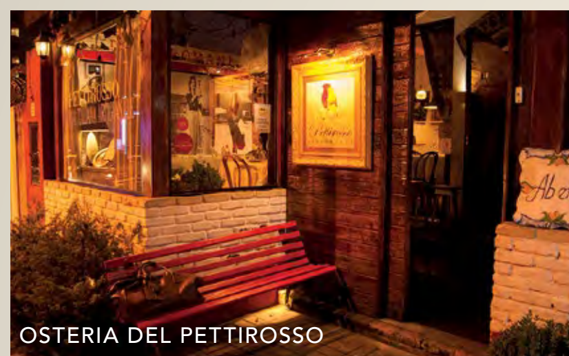
OSTERIA DEL PETTIROSSO