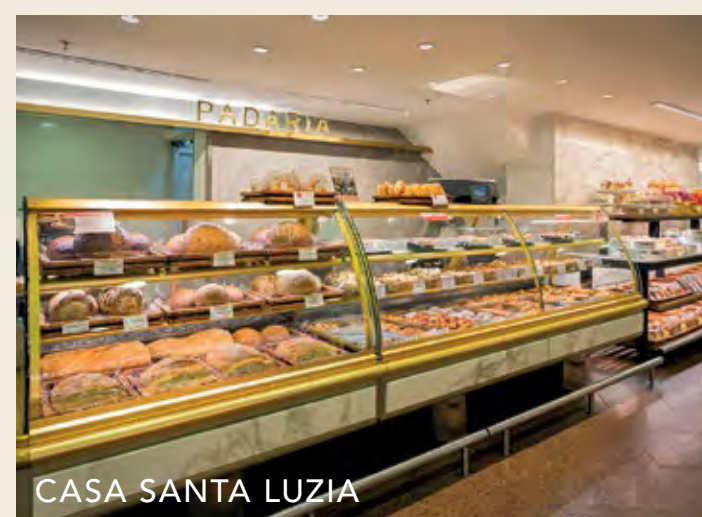
CASA SANTA LUZIA